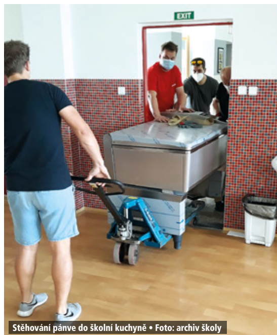
Stěhování pánve do školní kuchyně

Zároveň umožní i s dalším vybavením naší kuchyně navýšení kapacity uvařených obědů ve školní kuchyni.