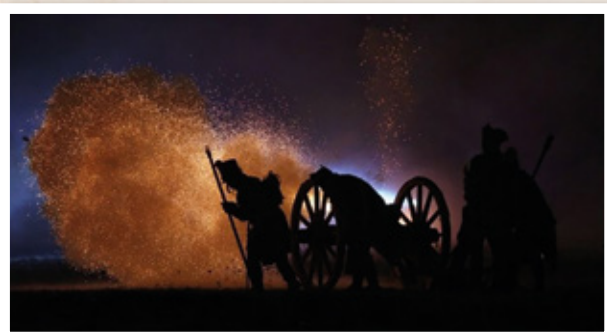
4. 12. Tenkrát ve Slavkově