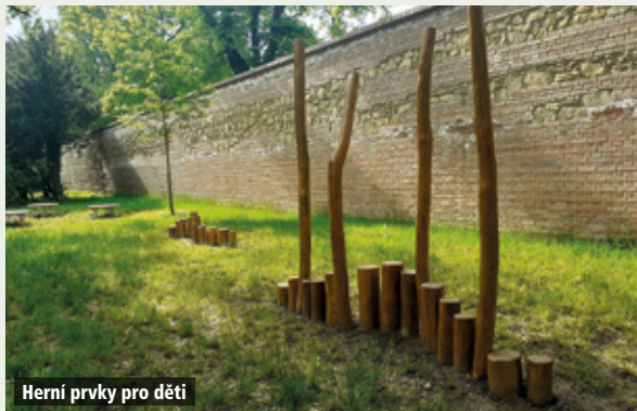
Herní prvky pro děti