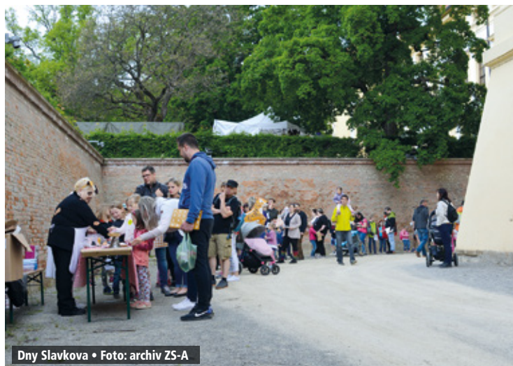
Dny Slavkova • Foto: archiv ZS-A