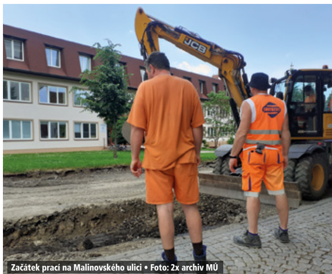
Začátek prací na Malinovského ulici