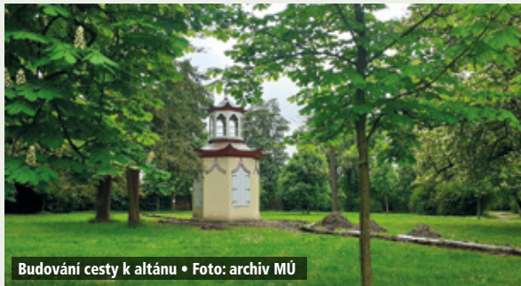
Budování cesty k altánu • Foto: archiv MÚ