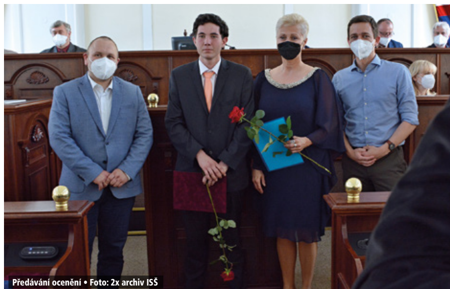
Předávání ocenění