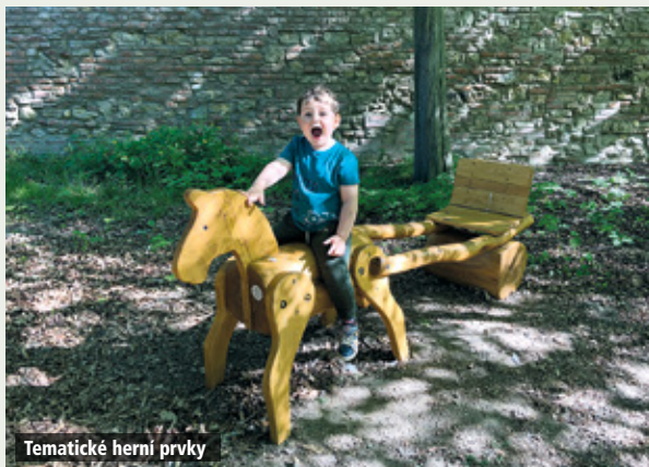
Tematické herní prvky