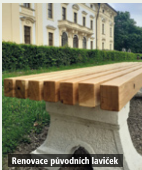
Renovace původních laviček