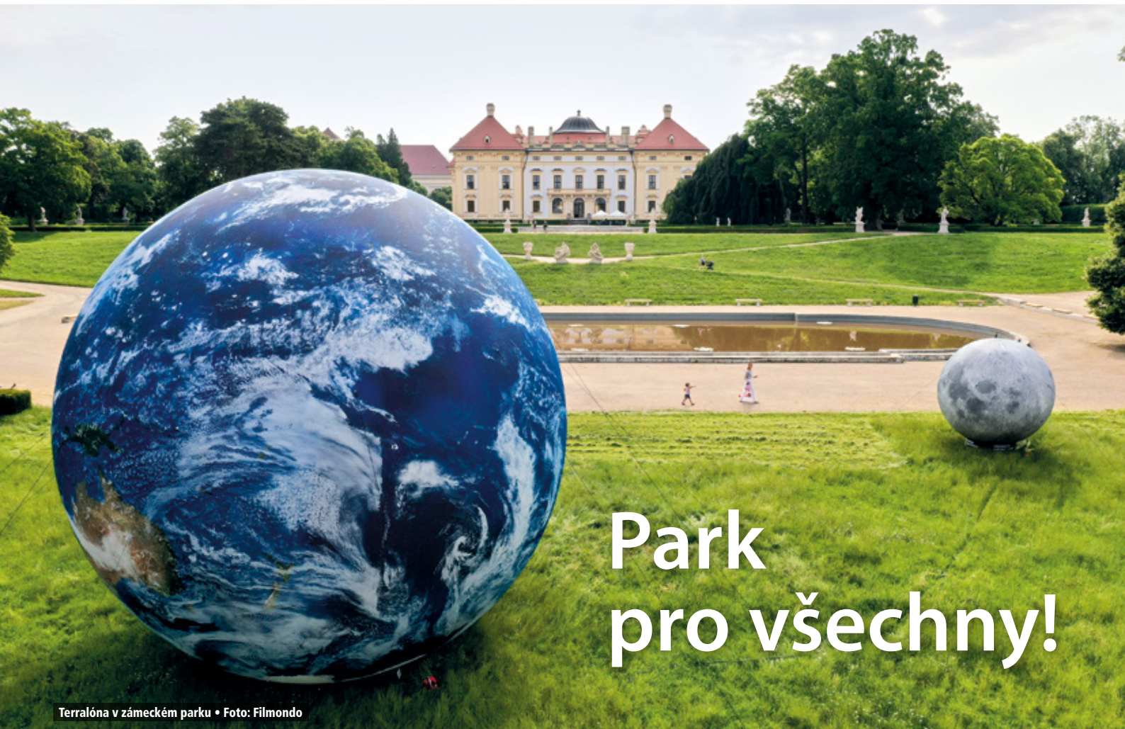
Terralóna v zámeckém parku

MĚSÍČNÍK MĚSTA SLAVKOV U BRNA • ROČNÍK XXIII • ZDARMA