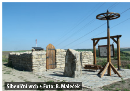
Šibeniční vrch

Jsmo rádi, že se naše dějepisná procházka vydařila a doufáme, že si děti kromě několika klíšťat odnesly i řadu zajímavých informací a poznatků o svém městě. pp