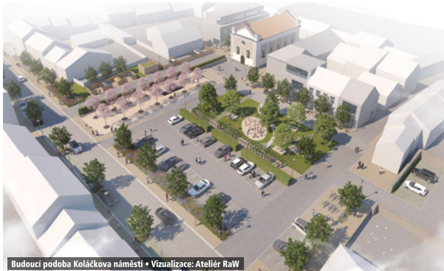
Budoucí podoba Koláčkova náměstí • Vizualizace: Ateliér RaW

Město nyní nechá zpracovat podrobnou dokumentaci potřebnou pro stavební povolení. O samotné realizaci však již rozhodne zastupitelstvo vzešlé z nových komunálních voleb, které se uskuteční v příštím roce na podzim. vs