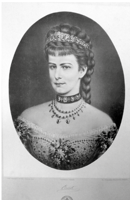
Alžběta Bavorská – Sisi

K jejím velkým zálibám patřila rovněž jízda na koni, učila se dokonce akrobatickým cvikům, které prováděla přímo při jízdě na koni. Výborně šermovala a rovněž výborně plavala – což bylo v jejich kruzích poměrně neobvyklé. Alžběta byla známá svými dlouhými a rychlými pochody, které trvaly i několik hodin. Není bez zajímavosti, že ji kvůli této zálibě opouštěly mnohé dvorní dámy,