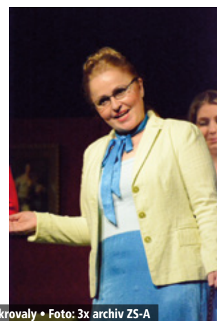
Divadelní představení Když hrdličky cukrovaly • Foto: 3x archiv ZS-A