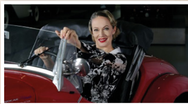
4. 9. Veteranfest