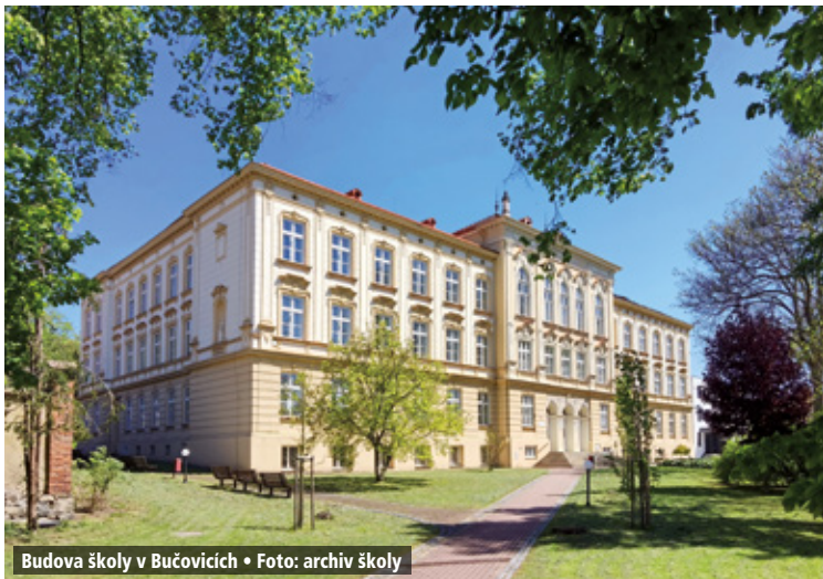
Budova školy v Bučovicích

Historická budova gymnázia sloužila čtyři desetiletí žákům jiné školy. Nejdříve to byla zemědělská účetnická škola (založena roku