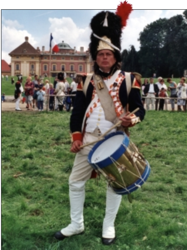
Zanedlouhou se Slavkovem opět rozezní bubny císařských armád. Centrum města bude hostit tradiční Napoleonské dny.