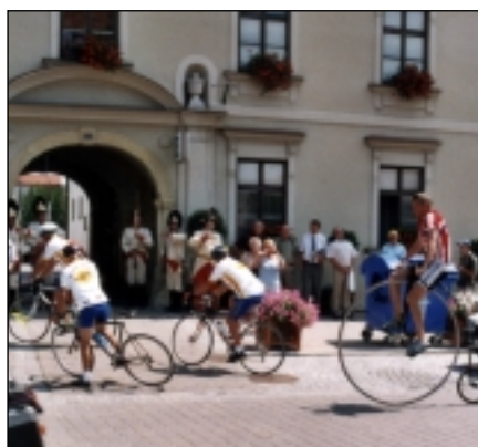
Přijezd cyklistů před radnici ve Slavkově.