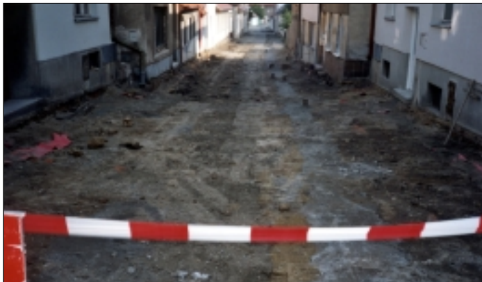
Rekonstrukce ulice Úzká. Vpravo opravená křižovatka Lidická–Bučovická a ve výřezu její průběh.