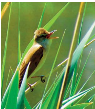
Rákosník zpěvný

M. Hrabovský , Slavkovský ochranný spolek