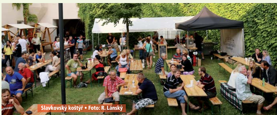
Slavkovský košťýř • Foto: R. Lánský