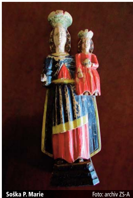
Soška P. Marie