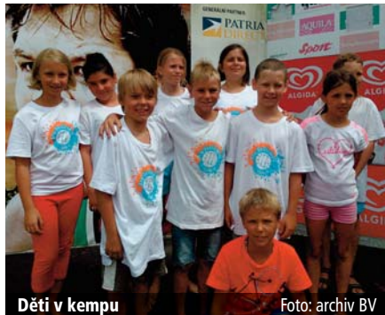
Děti v kempu