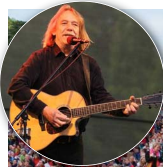
Koncert J. Nohavici (ve výřezu Jaromír Nohavica)