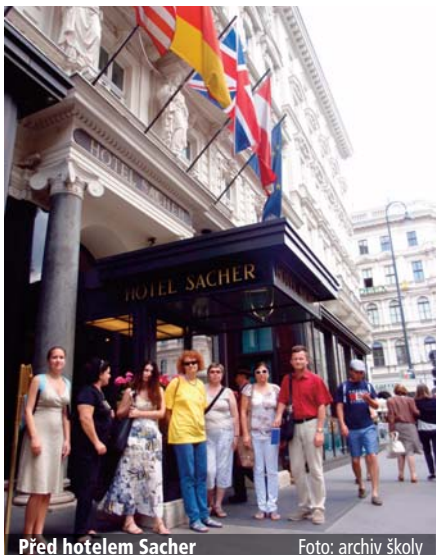
Před hotelem Sacher