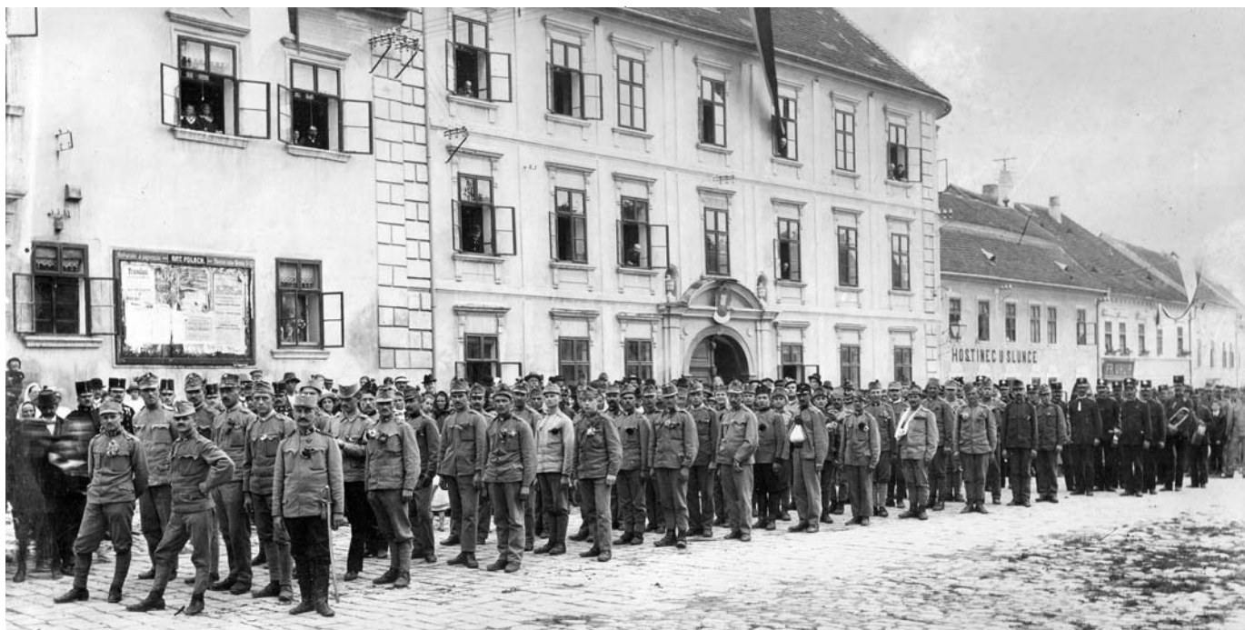
Vojáci rakouské armády nastoupení na Palackého náměstí ve Slavkově. V popředí stojí hejtman s šaví a černými kalhotami. Podle plakátů na stěně radnice (představení V zakletém zámku) jde o srpen roku 1915, kdy tuto divadelní hru sehráli Studující města Slavkova v režii Františka Uhlíře. Za popis fotografie děkují S. Olbrichtovi, J. Seifertovi a J. Strašilovi.