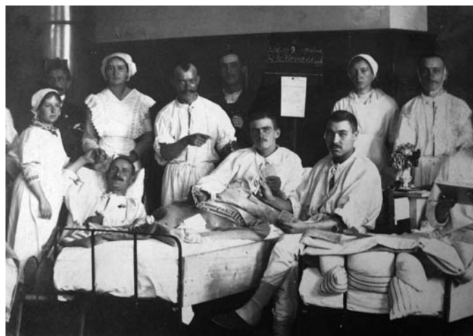
Vojenská nemocnice v prostorách dnešní ZŠ Komenského ve Slavkově