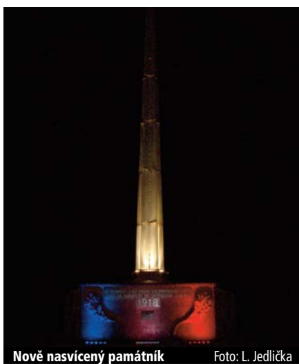
Nově nasvícený památník

V sobotu v pozdních večerních hodinách bylo slavnostně rozsvíceno nově instalované osvětlení památníku na návrší Kléber, v němž dominují barvy bílého, červeného a modrého světla, tedy základní barvy na české, slovenské a francouzské vlajce. Poté si účastníci akce prohlédli v sále naproti muzeu (zaměřeného na historii čs. legií ve Francii) obsáhlou putovní výstavu o letech 1914 až 1918, kterou jsme s sebou přivezli. Tato výstava byla nedávno také zpřístupněna slavkovské veřejnosti na naší radnici. Na 24 panelech velmi názorně a poutavě popisuje události tohoto období. Výstava byla v Darney dobře hodnocena přítomnými návštěvníky a zejména vojenskými odborníky.