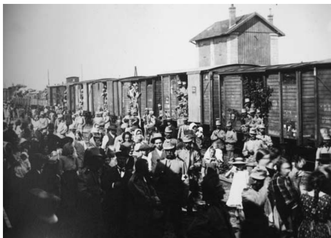
Odjezd vojáků do války ze slavkovského nádraží – 11. 8. 1914

Československé legie se podílely na vítězství Dohody v I. světové válce. Z vojenského hlediska to byl Milan Rastislav Štefánik, který byl v té době již generálem francouzské armády a podílel se s českou emigrací jako diplomat na jednání o vzniku Československé republiky, aktivně organizoval vznik čs. legií zejména nábořem na italské a francouzské frontě a mezi vojenskými zajatci v Rusku a podpoře myšlenky Československa mezi americkými Slováky.