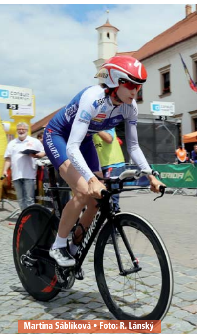
Martina Sáblíková