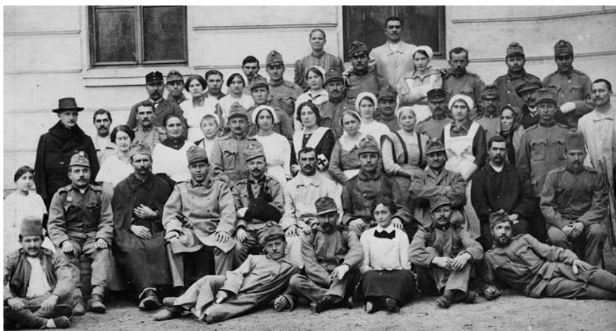
Zranění vojáci s ošetřujícím personálem v prostorách dnešní ZŠ Komenského ve Slavkově

V těch se dočítáme, že po vypuknutí války vydala c.k. zemská školní rada moravská řadu výnosů, z nichž 28 je zaznamenáno v kronice. Týkaly se převážně toho, že je možné upravovat vyučování dle potřeb a dále ukládaly učitelům vést žáky k humanitárním akcím pro účely Červeného kříže. V hodinách předmětu domácí práce měly žáky zhotovovat nákolénky, šály, ochranné kukly proti mrazu, teplá objímadla a další. Výnosy umožňovaly omlouvat školou povinné děti z rodin, které byly dotčeny všeobecnou mobilizací, aby se v případě potřeby mohly zúčastňovat domácích prací. Odvedení ženatí učitelé měli dostávat celý plat, svobodní pouze polovinu platu. Učitelům, kteří byli povoláni do války, se započítávala doba strávená na bojišti, jako by učili. Žákům bylo zakázáno navštěvovat tělovýchovné kurzy Sokola a Orla. Ukládalo se jim účastnit se prací při žních, projít si vojenskou