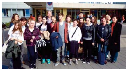
Naši žáci v zahraničí

o životě a kultuře např. Peru, Egypta, Indonésie či Rakouska, Německa a Polska. Stranou nezůstali naši kolegové-pedagogové, kteří si iniciativně zapojili do projektů a odborných zahraničních stáží pro pedagogy a do zahraničí tak vycestovalo celých 52 %. I v příštím školním roce chceme umožnit žákům získávat pracovní i odborné znalosti mimo hranice ČR, neboť jejich uplatnitelnost na trhu práce se rapidně zvyšuje nejen na úrovni regionu, v němž žijí, ale i v rámci celé Evropy. Vedení ISS