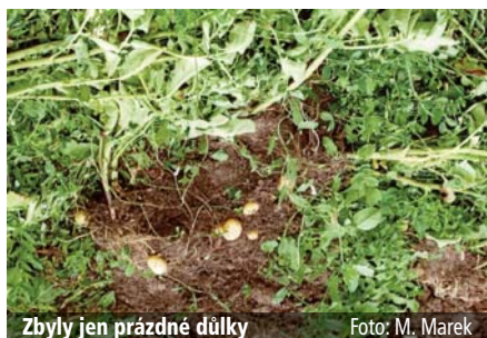
Zbyly jen prázdné dílky