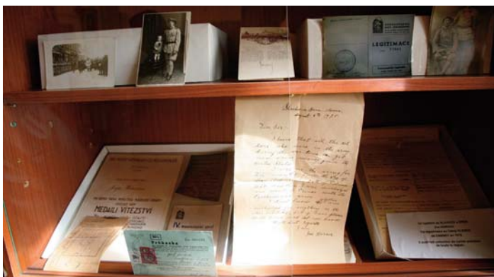
Vitrína v muzeu ve francouzském Darney věnovaná Josefu Hořavovi

narozen 22. 4. 1896 v Uhřicích Nastoupil k 25. zemskému polnímu pluku R-U armády v hodnosti vojína. Zaját 17. 9. 1915 v Lucku. Do legií se přihlásil v Bobrjusk a zařazen do bojů byl 5. 7. 1917 jako desátník. V legiích skončil 17. 8. 1920.