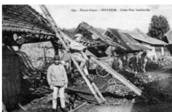
Zničená továrna v Alsasku