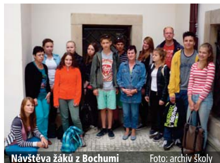
Návštěva žáků z Bochumi