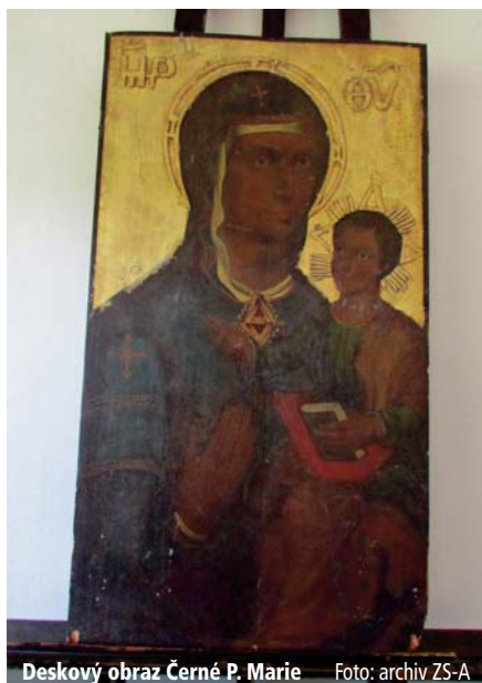
Deskový obraz Černé P. Marie