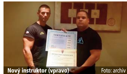
Nový instruktor (vpravo)