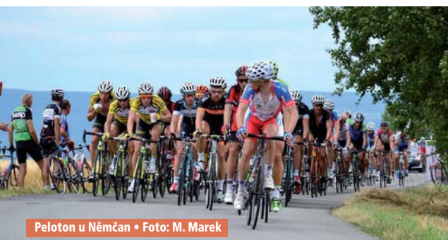
Peloton u Němčan