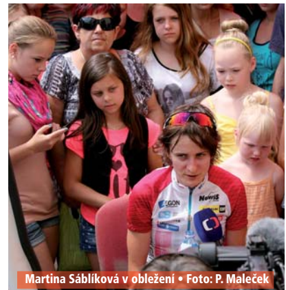
Martina Sáblíková v obležení