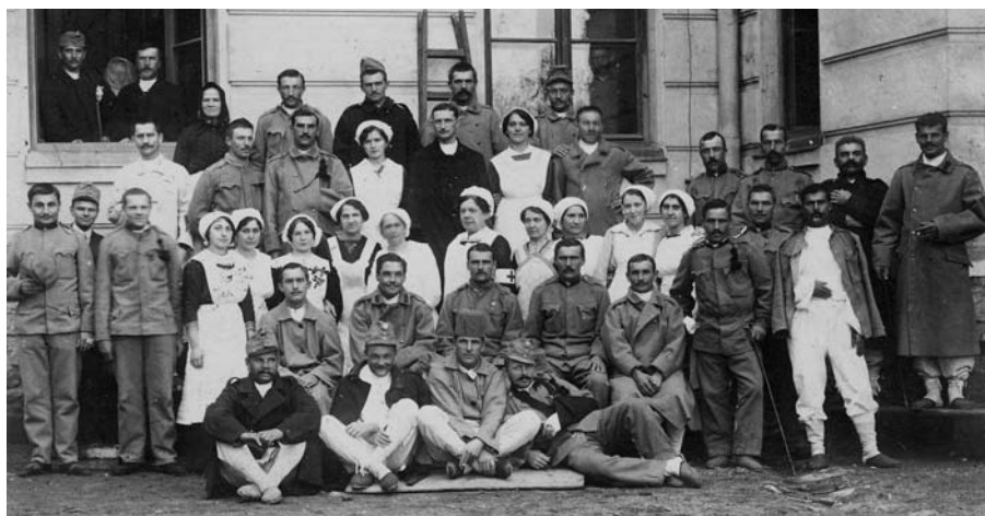
Vojáci-pacienti s ošetřovatelkami na dvoře dočasné vojenské nemocnice (dnes ZŠ Komenského ve Slavkově)