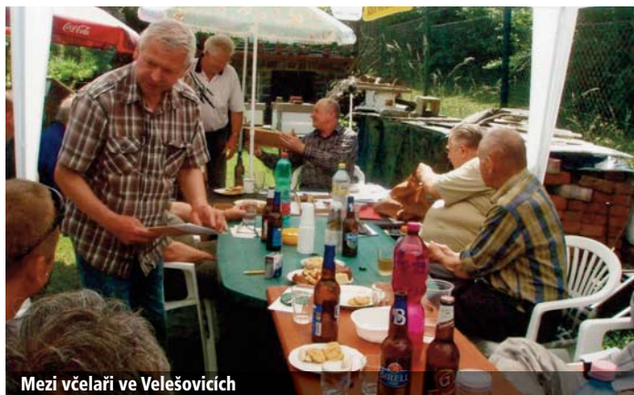
Mezi včelaři ve Velešovicích