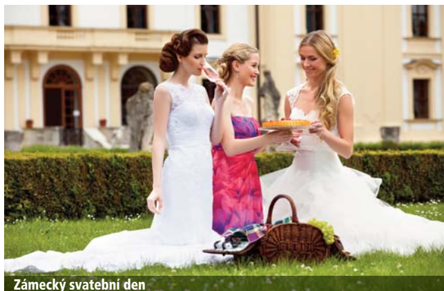
Zámecký svatební den