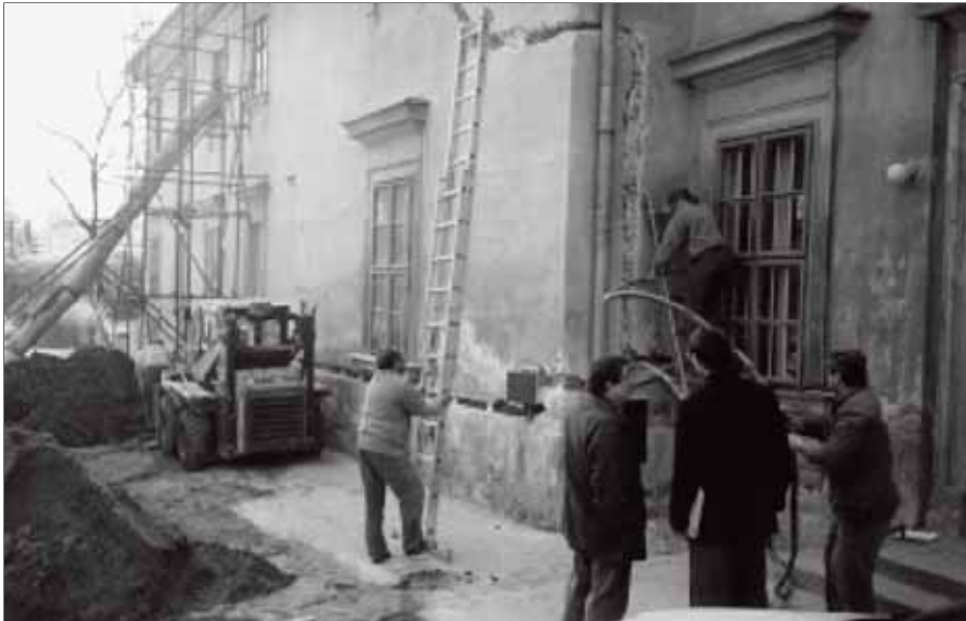
Na rekonstrukci slavkovské fary se podíleli také dobrovolníci