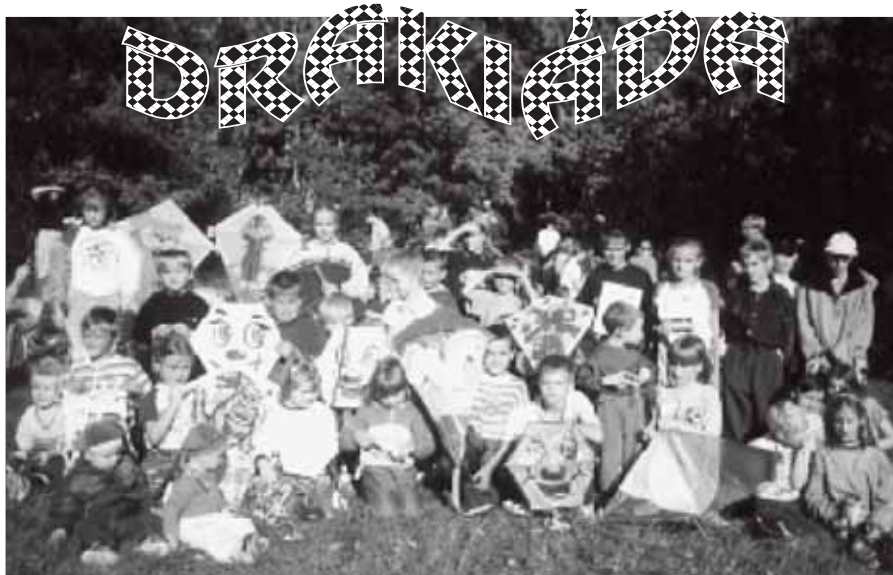
Vysokou účast a nádherné slunečné počasí měla oblíbená a tradiční DRAKIÁDA, akce Domu dětí a mládeže ve Slavkově u Brna. V sobotu 2. října 1999 se sešlo na střelnici na 160 dětí a rodičů, aby prožili krásné podzimní odpoledne. Soutěžilo se ve dvou kategoriích, a to draci vyrobení doma a draci kupovaní. Celkem vzlétlo 73 draků (z toho 21 vyrobených). Po rozdání diplomů, cen a sladkých odměn proběhlo opékání špekáčků a posezení u ohně. DDM Slavkov děkuje Mysliveckému sdružení, Jitce Floriánové - Potraviny Kořinek, firmě Mountfield Rousínov.

Zájezd se nám všem opravdu líbil a těšíme se, co si pro nás Antonín Křivonožka alias Yetti připraví za rok. Středisko Junáku Slavkov