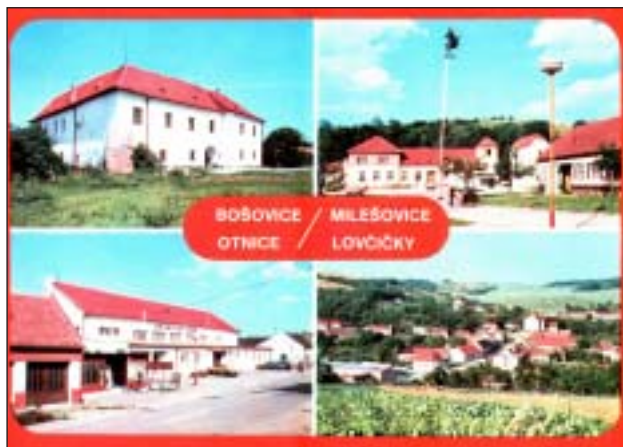
Kombinovaná pohlednice – Bošovice, Milešovice, Otnice a Lovčičky