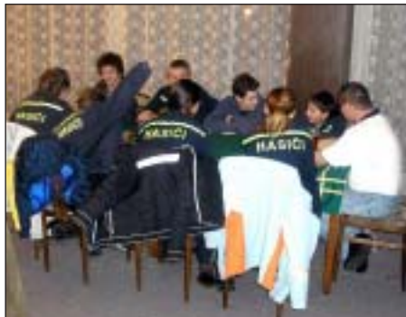
Družstvo mládeže SDH