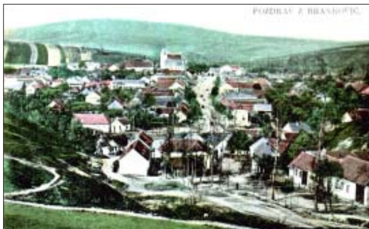
Kolorovaná pohlednice s celkovým záběrem Brankovic – 20.–30. léta 20. stol.