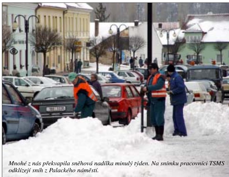
Mnohé z nás překvapila sněhová nadílka minulý týden. Na snímku pracovníci TSMS odklízejí sníh z Palackého náměstí.