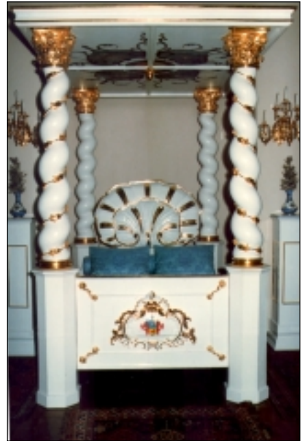
Tzv. „napoleonská postel“.