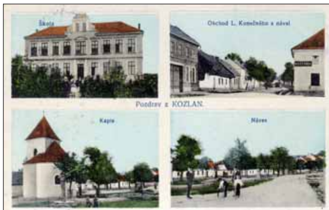
Kozlany – kolorovaná pohlednice z r. 1914

Ve čtvrtek 18. 5. 2006 si nenechte ujít vernisáž výstavy květin „Z pohádky do pohádky“. Výstavu pořádá Historické muzeum ve spolupráci se Střední zahradnickou školou, Středním odborným učilištěm a Učilištěm Rajhrad. Vernisáž s módní přehlídkou pohádkových kostýmů proběhne v 17 hodin v Historickém sále slavkovského zámku. Výstava potrvá do 25. 5. 2006 a bude přístupná souběžně s provozem zámku Slavkov.