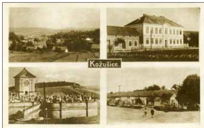
Kožušice – Pohled na školu, náves a barokní hřbitov v blízkých Strávkách