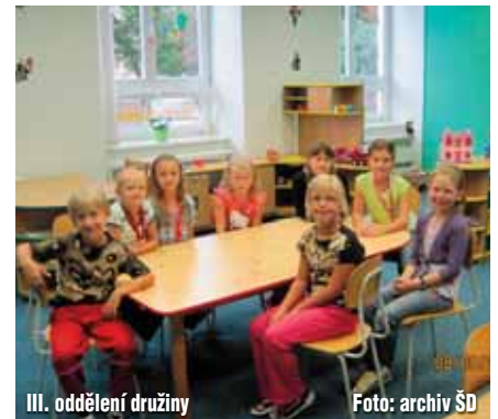
III. oddělení družiny