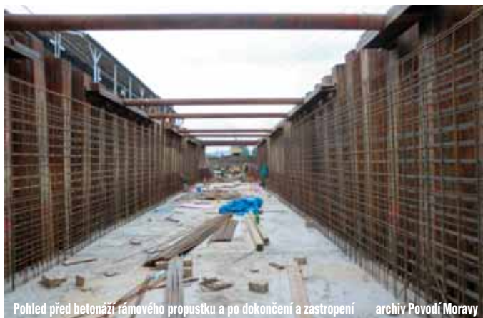
Pohled před betonáží rámového propustku a po dokončení a zastropení