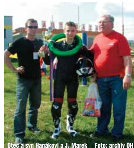
Otec a syn Hanákoví a J. Marek

Ano, mají. Je to Pohár ČR na přírodních tratích. Uděluje se vždy na posledním závodě podle bodových hodnocení v tabulce.