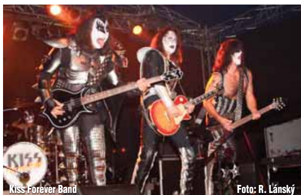
Kiss Forever Band