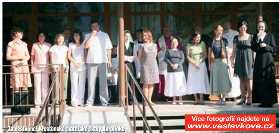
Zaměstnanci Křesťanské materské školy Karolínka

Více fotografií najdete na www.veslavkove.cz