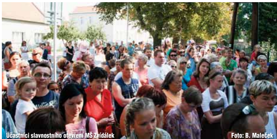
Účastníci slavnostního otevření MŠ Zvidálek