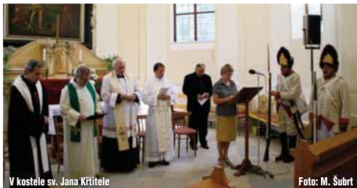
V kostele sv. Jana Křtitele