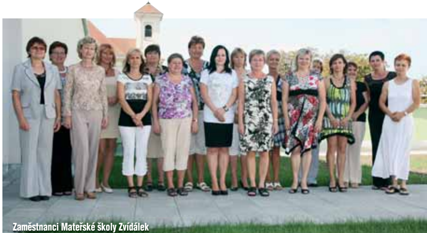
Zaměstnanci Materské školy Zvídálek