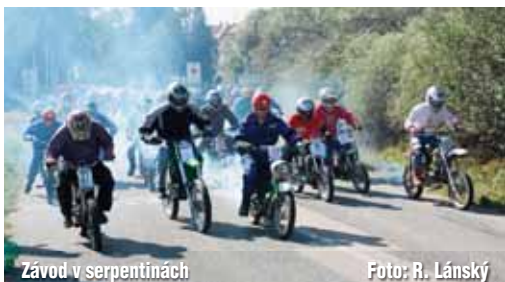
Závod v serpentínách

Letošní seriál závodů „O pohár starosty města“ fechtlů a Pitbikeů ve Slavkově u Brna ukončen posledním závodem Zavíráním šoupaték na ploché dráze , který se bude konat 30. prosince 2011. Za MK J.Z.