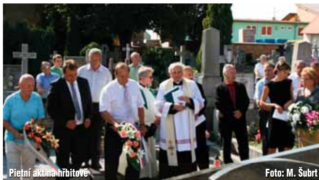
Pietní akt na hřbitově