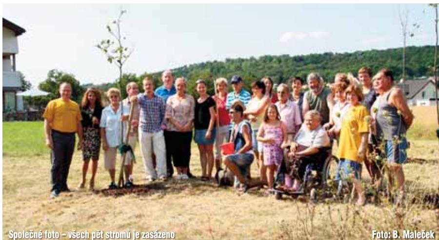
Společné foto – všech pět stromů je zasazeno