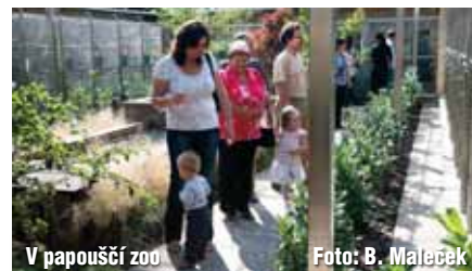
V papouščí zoo

Papouščí zoologická zahrada vyrostla po letech usilovné práce především svých majitelů a za velké pomoci spolupracujících firem a jednotlivců. A právě těm chtěli majitelé poděkovat za jejich pomoc při budování tohoto unikátního zařízení a pozvali je v sobotu 17. září do Bošovic na přátelské setkání. Sešlo se jich několik desítek a většina se zde viděla poprvé. Prosluněné odpolední setkání se neslo v duchu podobných milých setkání a všechny hřál pocit z dobře vykonané práce. red.