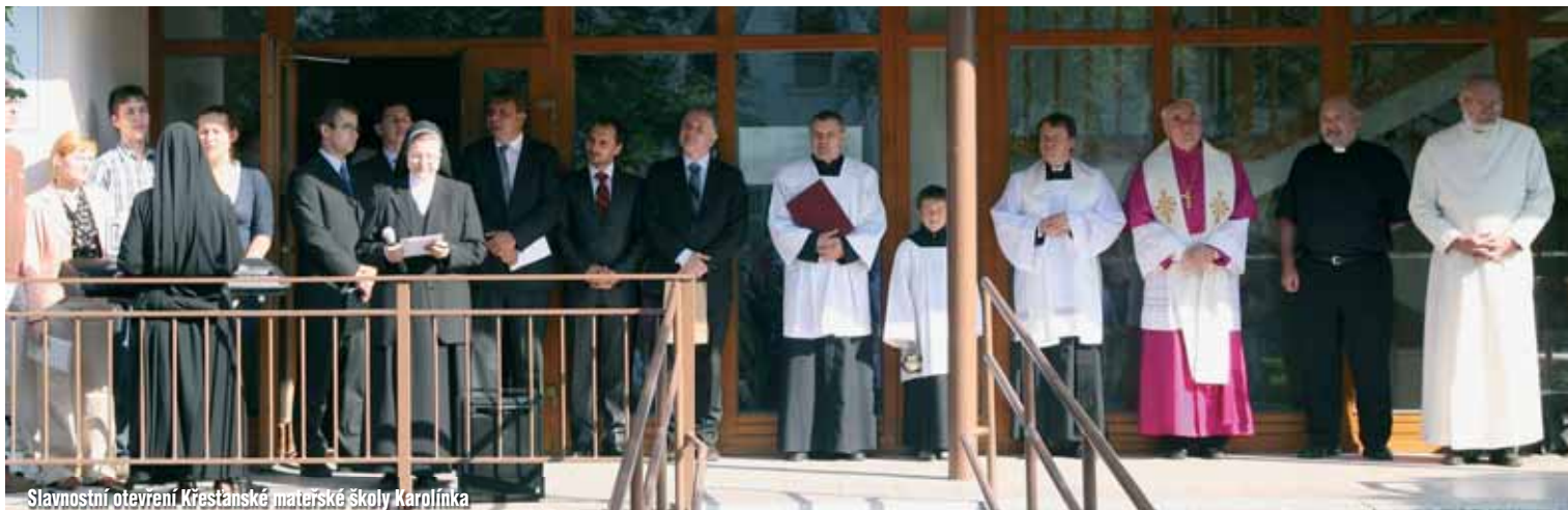
Slavnostní otevření Křesťanské materské školy Karolínka