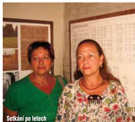
Setkání po letech