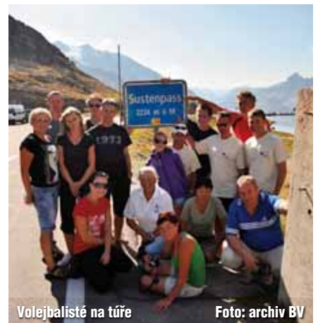
Volejbalisté na túře