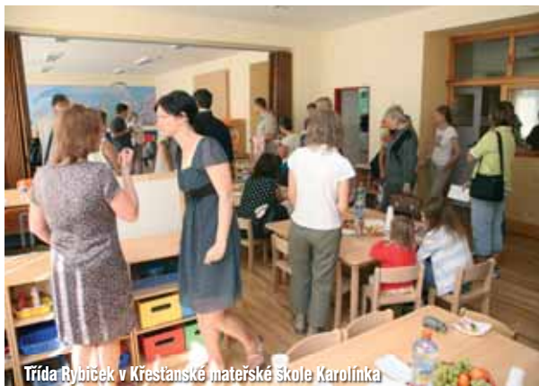
Třída Rybiček v Křesťanské materské škole Karolínka