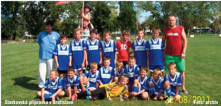
Slavkovská příprava v Bratislavě