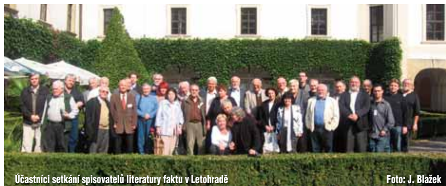
Účastníci setkání spisovatelů literatury faktu v Letohradě