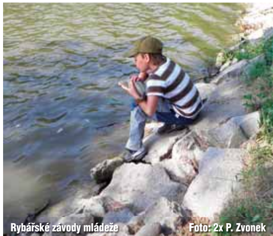
Rybářské závody mládeže