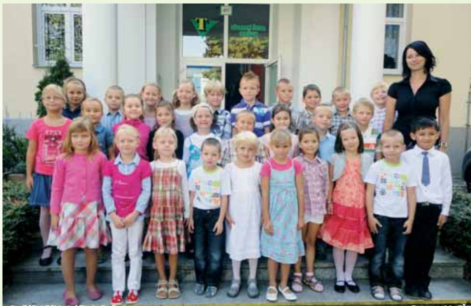
Prvňáčci Základní školy Tyršova