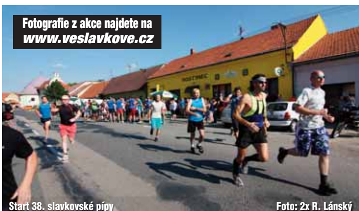
Fotografie z akce najdete na www.veslavkove.cz