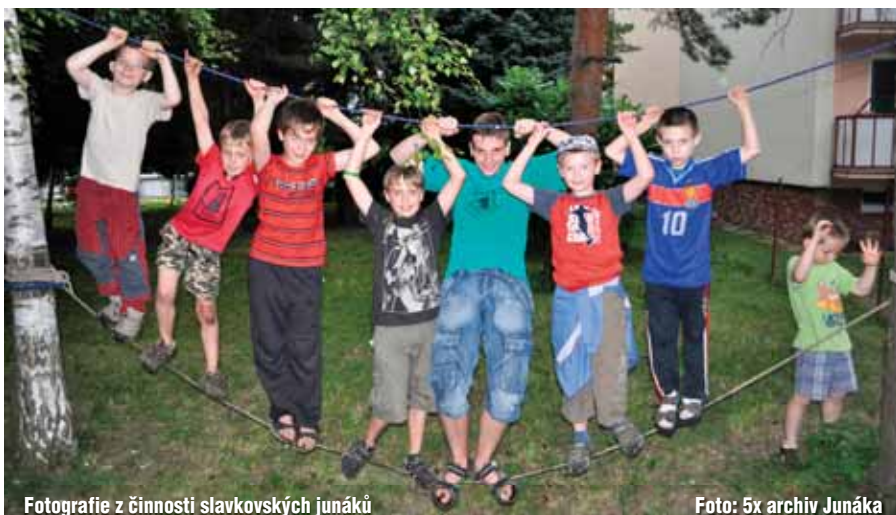
Fotografie z činnosti slavkovských junáků