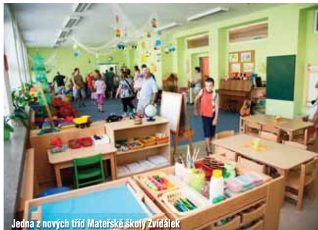
Jedna z nových tříd Materské školy Zvídálek