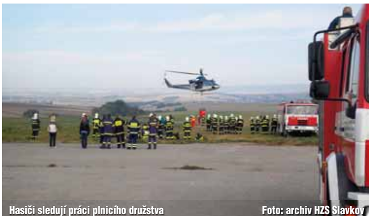
Hasiči sledují práci plnicího družstva