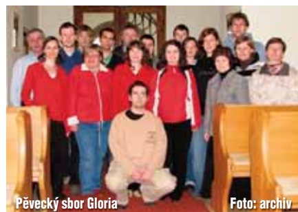
Pěvecký sbor Gloria