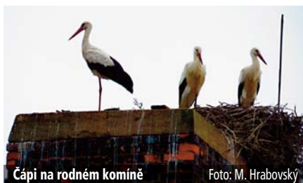
Čápi na rodném komíně

Naším čápům však podobné nebezpečí na komíně v oblasti bývalého Agrozetu nehrozí. Jejich hnízdo zabírá jen část prostoru na komíně, ostatní plocha mladým čápům znamenitě slouží k učení startu, přistávání nebo i hravým potyčkám. Čápi se hlasovými projevy údajně nedorozumívají, je však poznat, že si dobře rozumí, jako by říkali: „podívej, jak vysoko už mne křídla nesou, už jsou to jistě 2 metry.“ „to nic není, já vylétnu ještě výš, dívej se!“ I když jsou mláďata vzletná, umí létat, jsou stále na rodičích závislá. Mnoho času stráví úpravou peří a čekáním na rodiče. Stojí obě vedle sebe na okraji komína se zrakem upřeným ve směru, kam rodiče odlétali za potravou, nic jim neujde,