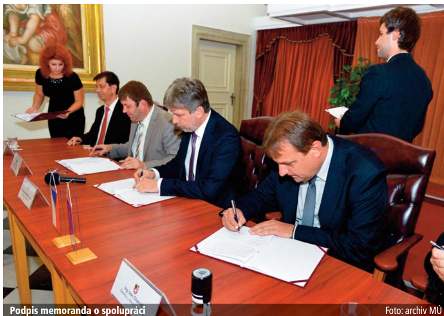
Podpis memoranda o spolupráci