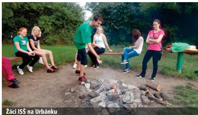
Žáci ISS na Urbánku