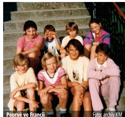
Poprvé ve Francii