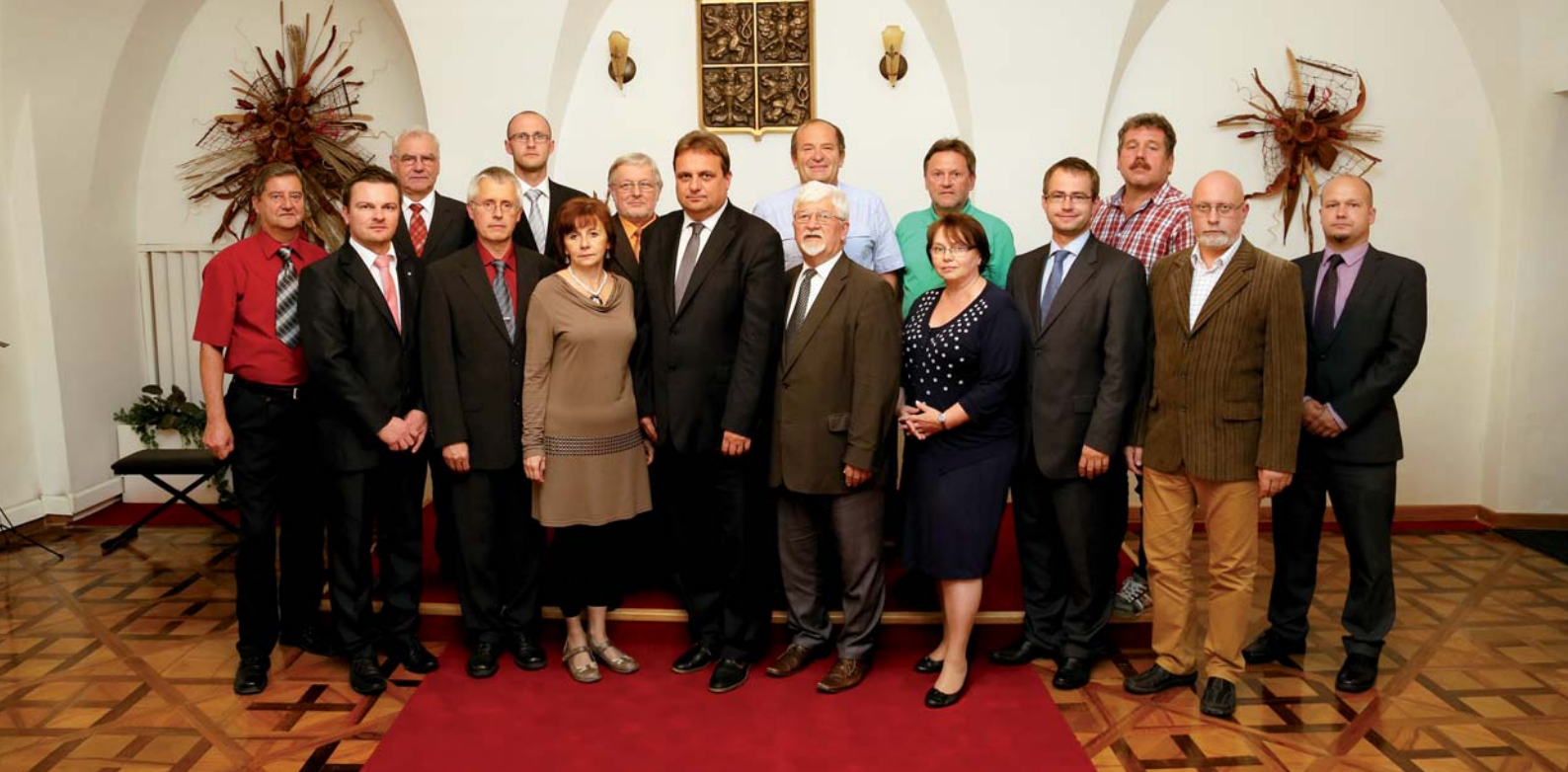
Zastupitelé města Slavkova u Brna ve volebním období 2010–2014