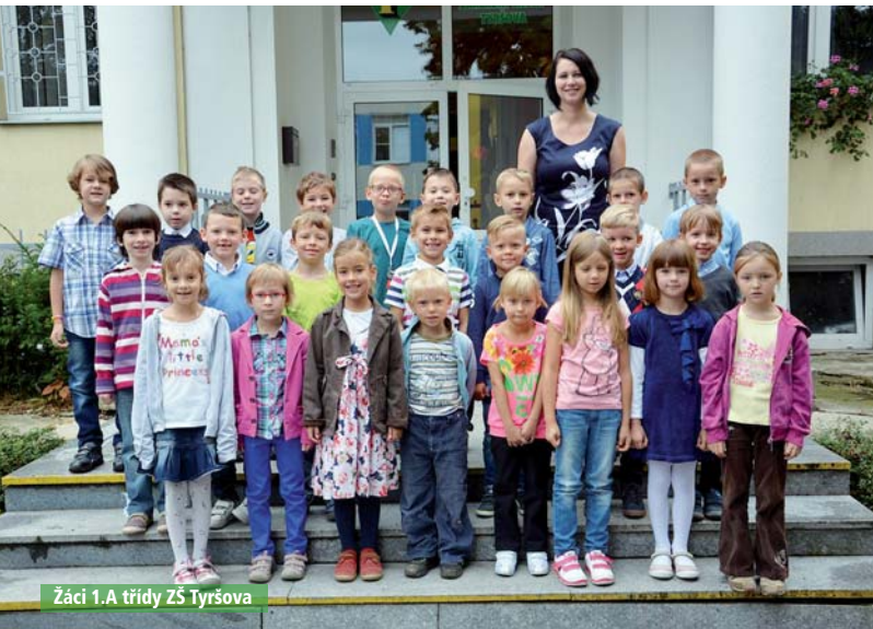
Žáci 1.A třídy ZŠ Tyršova