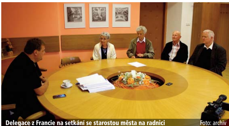
Delegace z Francie na setkání se starostou města na radnici