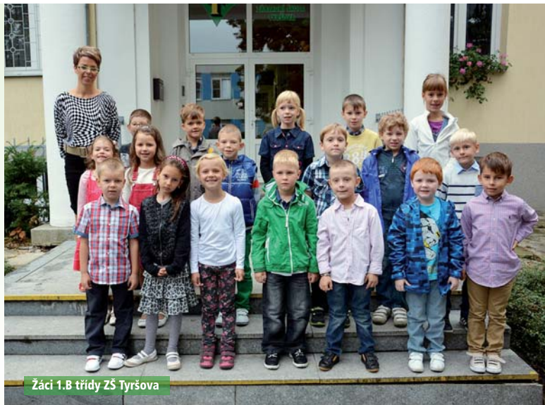
Žáci 1.B třídy ZŠ Tyršova