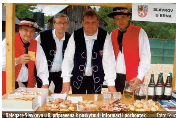
Delegace Slavkova u B. připravena k poskytnutí informací i pochoutek