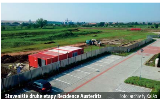
Staveniště druhé etapy Rezidence Austerlitz

Bližší informace a kontakty najdete na www.junakslavkov.cz