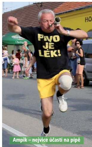
Ampik – nejvíce účastí na pípě