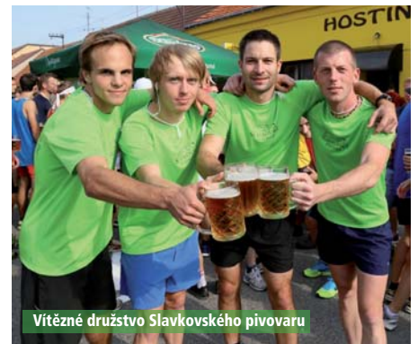
Vítězné družstvo Slavkovského pivovaru