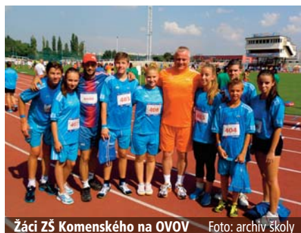
Žáci ZŠ Komenského na OVOV

V příštím školním roce doplníme ještě písčoviště, které bude sloužit v převážné míře dětem ze školní družiny. Vladimír Soukop