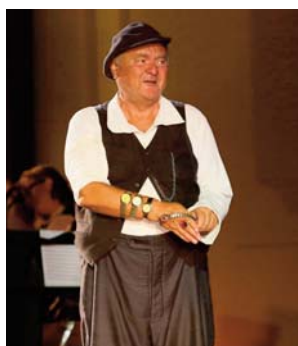
Divadelní představení Scapinova šibalství na nádvoří zámku